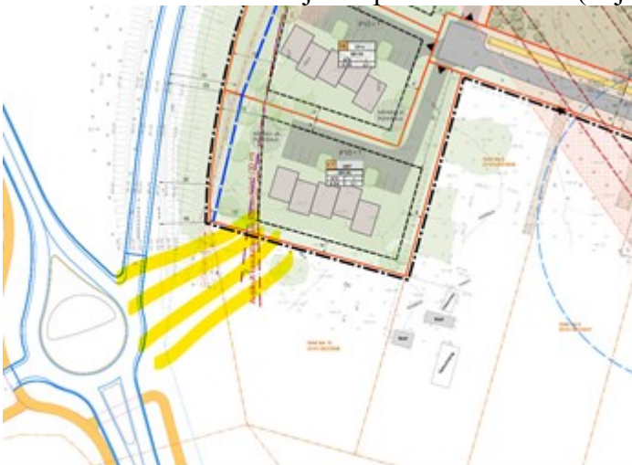
Joonis nr 3. Müraseinaga katmata ala.

Oleme 17.12.2024 kirjaga nr 7.2-2/24/19833-2 andnud seiskohad planeeringu koostamiseks. Meie kirja punkti 14 kohaselt täiendada planeeringu seletuskirja punkti 6.7.4. Müratõkkesein . Lisada seletuskirja, et Transpordiamet ei võta endale kohustust kavandatava arendusega seotud müraleevendusmeetmete projekteerimiseks ega väljaehitamiseks. Müratõkkeseina rajamise kohustus on arendajal. Joonisel pikendada müratõkkeseina tingmärke, sest müra modelleerimise tulemusel võib tekkida vajadus pikemale seinale (vt joonis nr 3).