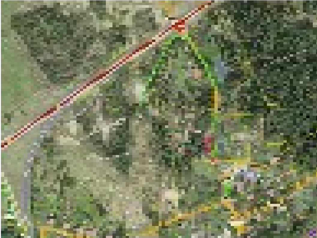
Joonis nr 2. Operatiivsõiduki juurdepääsu võimalus peale ristmiku sulgemist.

Nõo-Elva km 152,0-159,6 lõigu 2+2 ristlõikele ümberehituse järgselt muutub oluliselt põhimaantee ja ümberkaudsete teede liikluslahendus. Perspektiivis on kavandatud põhimaanteel Kulbilohu-Elva kohaliku tee ristmiku sulgemine (vt joonis nr 2). Sellest tulenevalt käsitleda seletuskirjas, millisel viisil on tagatud operatiivsõidukite juurdepääs ristmiku sulgemise järgses olukorras. Arvestada tuleb, et operatiivsõidukid saavad üldjuhul lõuna poolt, Elva linna suunalt.